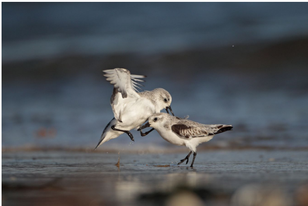
Hervé Grailot " Rivalité "