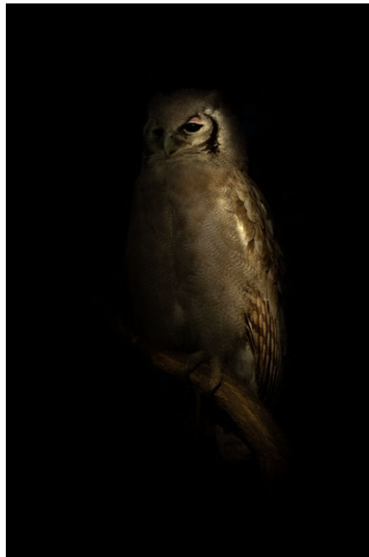
Laurence Meynard " Regard dans la nuit "